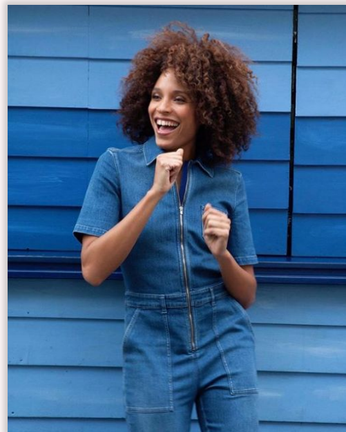
La citadine branchée