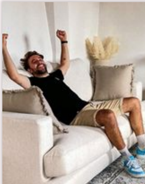
Le pragmatique dans l'air du temps