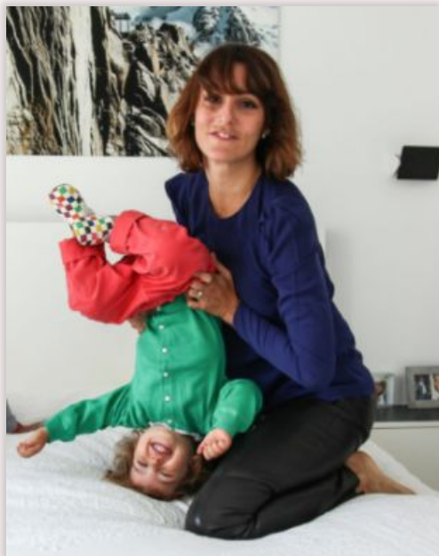
La maman plurielle